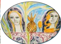
lo sagrado: piña, huevo serpiente